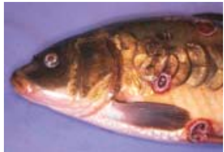
Carp gyda namau

Mae gwiriad iechyd ar gyfer pysgod bras yn ddilys am 6 mis. Mae gwiriad iechyd ar gyfer brithyllod ac eogiaid wedi'u ffermio yn ddilys am 12 mis.