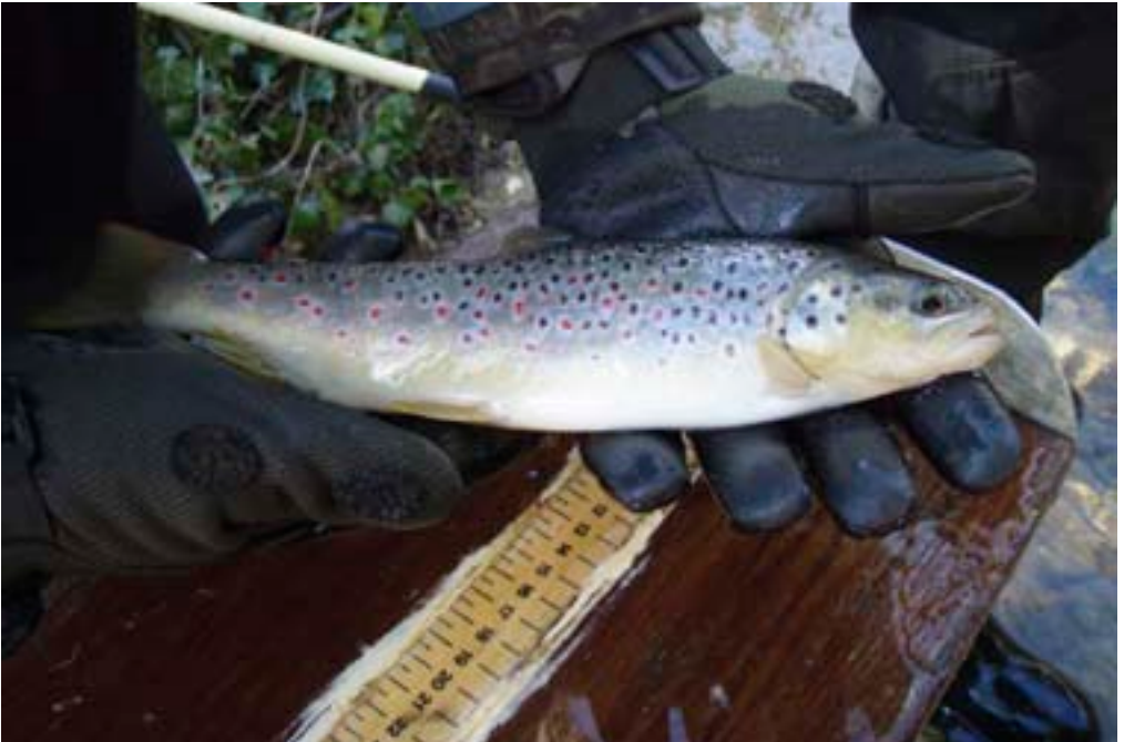
Brithyll brown gwyllt

chwiliad. Neu galwch ein tîm Gwasanaethau Cwsmeriaid ar 08708 506 506 .